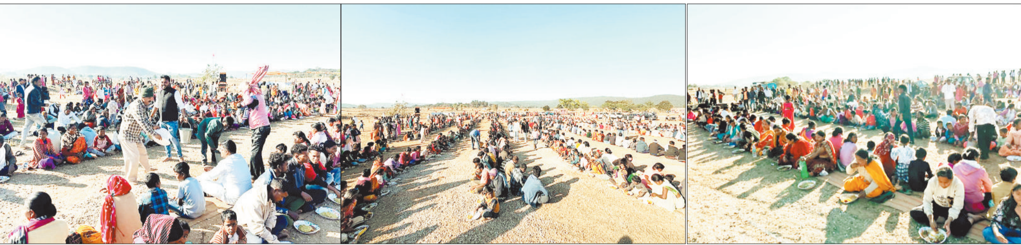
हरिभूमि न्यूज >>> जशपुरनगर

जिले के सुप्रसिद्ध आध्यात्मिक केंद्र ब्रह्मनिष्ठालय सोरगड़ा के तत्वावधान में अनन्य दिवस का पर्व पूरे भक्तिमय वातावरण में संपन्न हुआ। माघ कृष्णपक्ष चतुर्दशी पर चड़िया संगम तट श्रद्धालुओं की भारी भीड़ से सराबोर नजर आया। जय अचोरेश्वर के जयघोष से समूचा क्षेत्र गुंजायमान रहा।